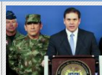
'Becerro' era el principal narcotraficante del noroccidente del país: Comandante FF.MM.