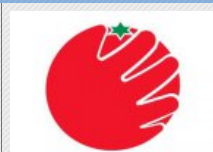
Fundador del Partido del Tomate tendrá puesto en el Gobierno