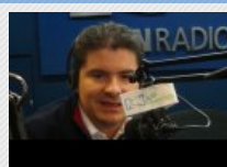
Hasta $86 millones financiará el Gobierno con el programa 'Mi Casa Ya': MinVivienda